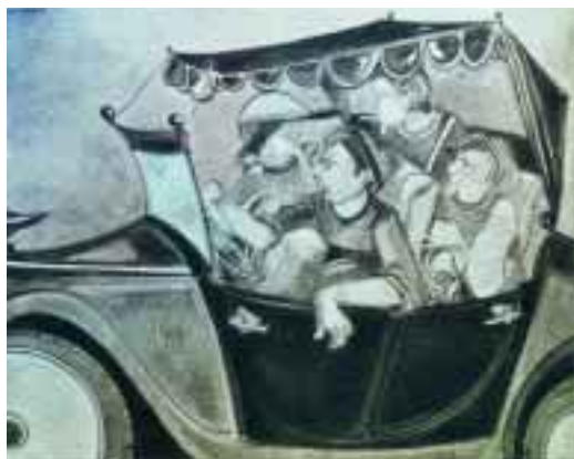
Passeggiata domenicale 2001, olio su tela (cm 78x98) € 1.560,00