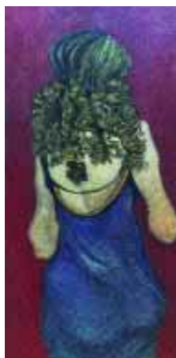
Si allontana 1998, olio su tela (cm 60x30) € 960,00

MidiaArte è una attività di MIDIA srl che propone ai lettori di PNEUMORAMA una galleria virtuale. Chi fosse interessato all'acquisto delle opere "esposte" e ad altre dello stesso artista può rivolgersi a MIDIA allo 039 2304440, inviare un fax allo 039 2304442, una e-mail a midia@tin.it