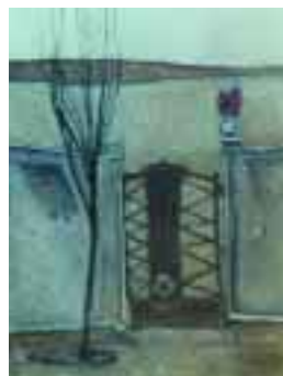
Oltre il cancello 2003, olio su tela (cm 40x30) € 720,00