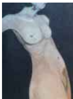
Quell'orecchino 2003, olio su tela (cm 40x30) € 720,00