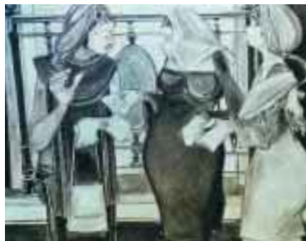
Le Comari 2000, olio su tela (cm 70x90) € 1.320,00