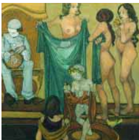
Le Tre Grazie 1997, olio su tela (cm 118x118) € 3.840,00