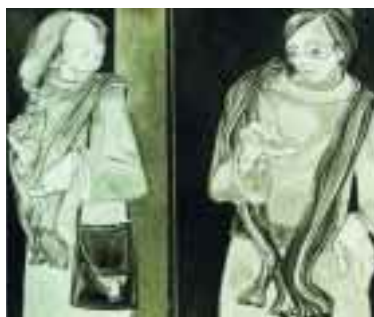
L'approccio 2000, olio su tela (cm 60x70) € 960,00