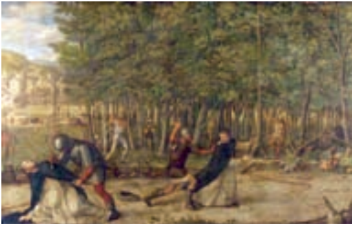
Giovanni Bellini: L'assassinio di San Pietro martire , 1507. The National Gallery of London.

“La prima volta che misi piede alla National Gallery fu nel 1948 per guardare questo dipinto commissionato da Riccardo II, il Dittico Wilton , di cui sapevo qualcosa solo perché seguivo un corso di storia su questo sovrano. Fino agli anni trenta, i critici erano interessati solo al lato estetico di un quadro e non al loro significato. Dopo l'arrivo negli anni '30 di molti storici dell'arte in fuga dalla Germania nazista ed esperti in iconografia, si cominciò a porre l'attenzione sul significato delle immagini, cioè l'iconografia, che ti fa rimanere più a lungo davanti ad un dipinto. Insomma, il fatto di scoprire che i dipinti potevano essere decodificati, che non erano solo esperienze estetiche, li inserì in un contesto più familiare e anche più inglese, se non altro perché gran parte dell'iconografia – raccontandoci chi è chi e cosa è cosa – può essere vista come una forma più elevata del nostro passatempo nazionale: il pettegolezzo”.