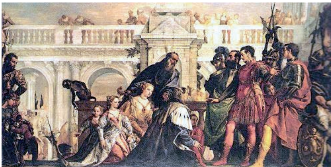
Paolo Veronese: La famiglia di Dario davanti ad Alessandro . The National Gallery of London.