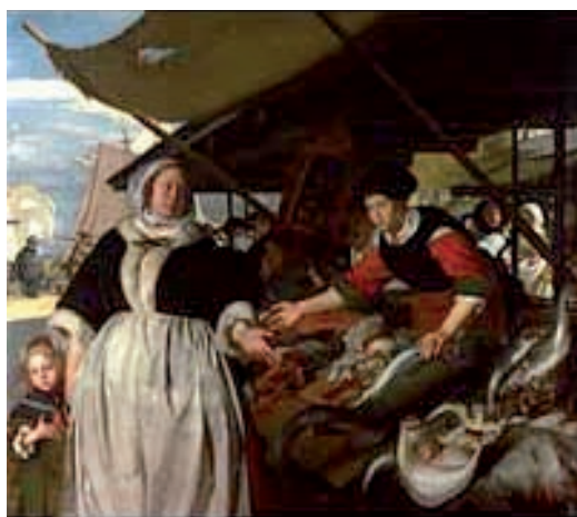
Emmanuel de Witte: Adriana van Heusedn e sua figlia al nuovo mercato del pesce di Amsterdam . 1662. The National Gallery of London .

Mike, ridendo, commenta: "Hai visto quante cose sa la mia bizzoca (bigotta)? (Il poliglotta, ovviamente, conosce anche il napoletano, ndr). Voglio ora smentire un equivoco. Molti credono che il non dover pagare per entrare alla National Gallery significhi sminuire l'arte