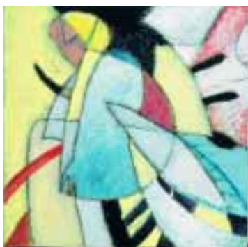
Dal ciclo Mediterraneo 1999, acrilico su cartone (33x33 cm) e 780,00