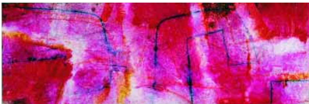
Terre rosse orizzontali (Dal ciclo Mediterraneo-Geoplan) 2004, tecnica mista su tavola (cassetta profonda 6 cm) (35x110 cm) e 1.920,00

MidiaArte è una attività di MIDIA srl che propone ai lettori di PNEUMORAMA una galleria virtuale. Chi fosse interessato all'acquisto delle opere "esposte" e ad altre dello stesso artista può rivolgersi a MIDIA allo 039 2304440, inviare un fax allo 039 2304442, una e-mail a midia@midiaonline.it . I prezzi delle opere esposte sono comprensivi di IVA e spese di trasporto sul territorio nazionale.