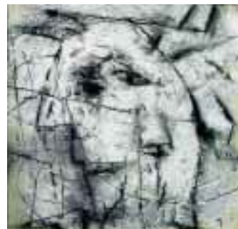
Dal ciclo Babilonesi 1996, gesso e grafite su cartone (20x20 cm) e 540,00

Bruno Paladin nasce il 9 novembre 1950 a Fiume, dove tuttora vive e lavora. Dal 1976 opera in quanto pittore, grafico, illustratore e scenografo. È membro sia del comitato fiumano che di quello zagabrese dell'Associazione degli artisti della Croazia. È libero professionista, membro della Comunità croata dei liberi professionisti. È stato insignito di numerosi premi e riconoscimenti. Le sue opere fanno parte di numerose collezioni di gallerie croate e internazionali di arte moderna.