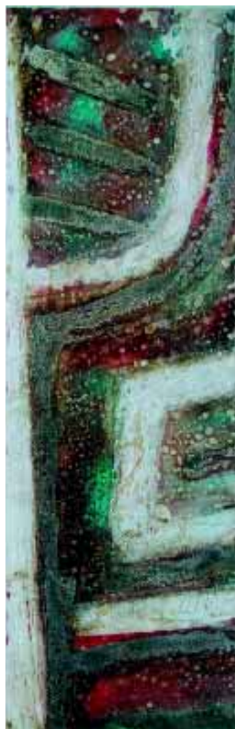
Terre rosse profumate (Dal ciclo Mediterraneo-Geoplan) 2003, tecnica mista su tavola (110x33 cm) e 1.920,00