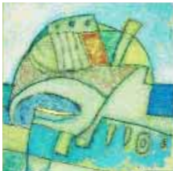
Dal ciclo Geoplan 1998, acrilico su cartone (33x33 cm) e 780,00