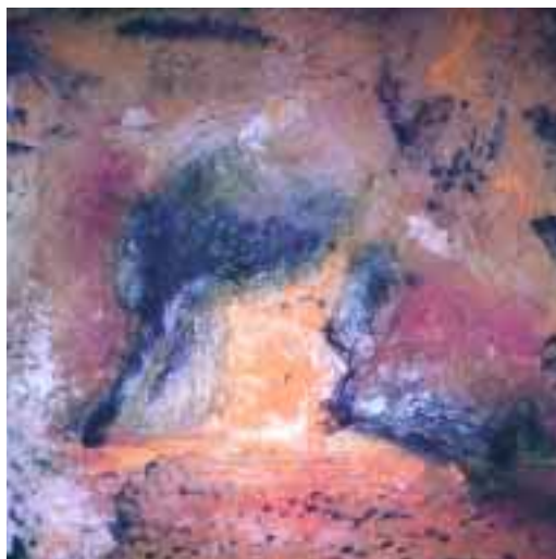
Giallo e blu 1997, tecnica mista su plexiglass (75x75) € 1920,00