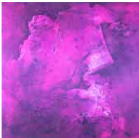
Senza titolo 1990, tecnica mista su carta (60x60) € 1560,00