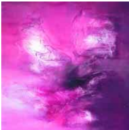
Reverie 1 1990, tecnica mista su tela (100x100) € 2400,00