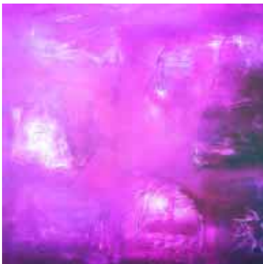
Reverie 2 1990, tecnica mista su tela (100x100) € 2400,00