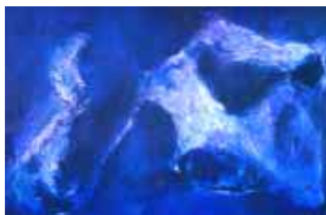
Danza 1998, tecnica mista su carta (57x38) € 1440,00

MidiaArte è una attività di MIDIA srl che propone ai lettori di PNEUMORAMA una galleria virtuale. Chi fosse interessato all'acquisto delle opere "esposte" e ad altre della stessa artista può rivolgersi a MIDIA allo 039 2304440, inviare un fax allo 039 2304442, una e-mail a midia@tin.it