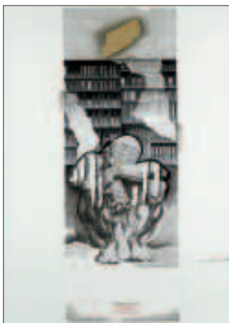
Pensatore/Progetto 11 1989, china, seppia e oro, opera unica su cartoncino (cm 70x50) € 1.980,00