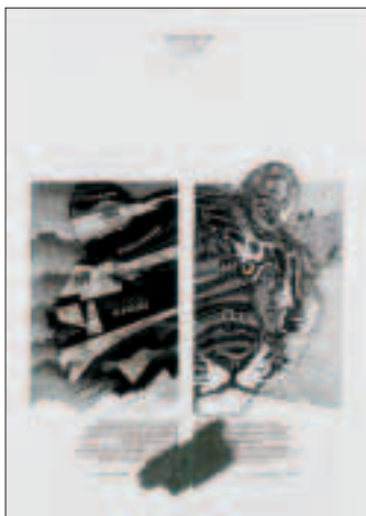
Fierezza stuprata/Progetto 50 1994, china, seppia e oro, opera unica su cartoncino (cm 70x50) € 1.980,00