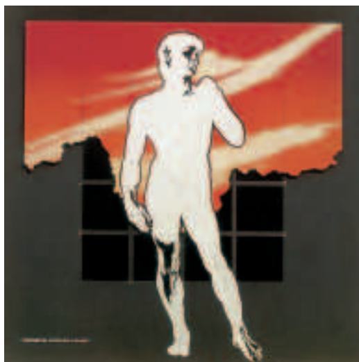
Stereometria articolata di un mito 1980, smalti e vernici sintetiche su metallo (cm 203x203) € 9.300,00