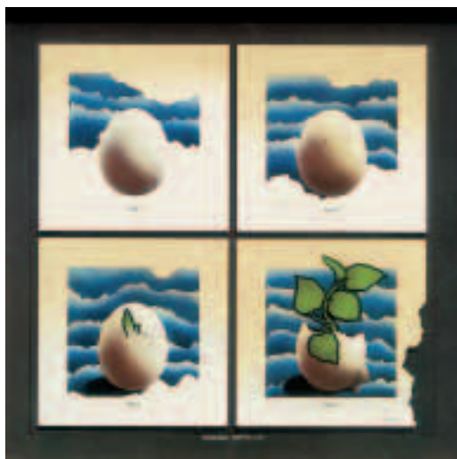
Programma genetico n. 23 1980, smalti e vernici sintetiche su metallo (cm 203x203) € 9.300,00