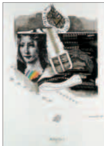
Pitti primavera/Progetto 6 1989, china, seppia e oro, opera unica su cartoncino (cm 70x50) € 1.980,00

MidiaArte è una attività di MIDIA srl che propone ai lettori di PNEUMORAMA una galleria virtuale. Chi fosse interessato all'acquisto delle opere "esposte" e ad altre dello stesso artista può rivolgersi a MIDIA allo 039 2304440, inviare un fax allo 039 2304442, una e-mail a midia@tin.it I prezzi delle opere esposte sono comprensivi di IVA e spese di trasporto sul territorio nazionale.