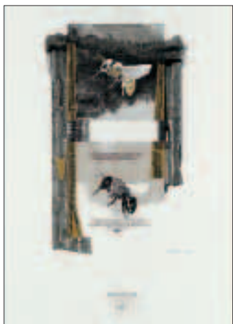
Metamorfosi/Progetto 39 1992, china, seppia e oro, opera unica su cartoncino (cm 70x50) € 1.980,00