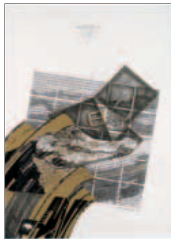
Beauty-case griffato/Progetto 73 1995, china, seppia e oro, opera unica su cartoncino (cm 70x50) € 1.980,00