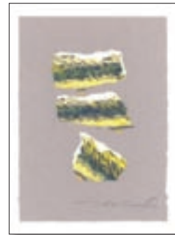
Marylin Monroe, studi 2007, 20x30 cm € 360,00