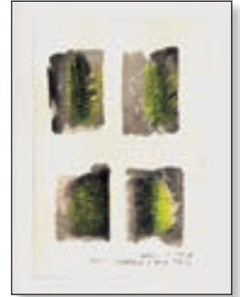
Richard Avedon, studi 2007, 20x30 cm € 360,00