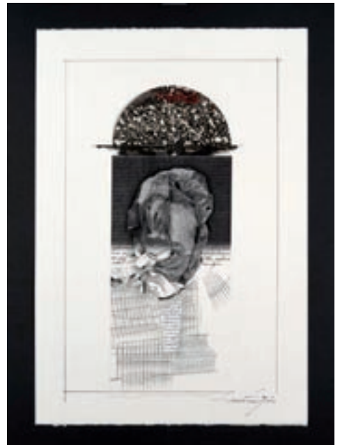
Richard Avedon F/1 2007, 50x70 cm € 3.600,00