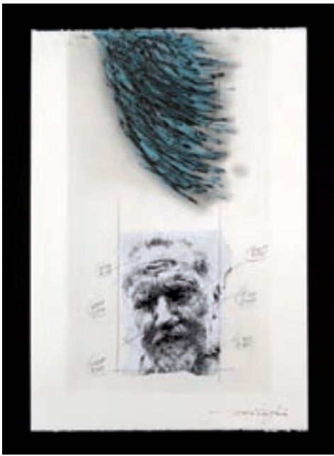
Ezra Pound F/1 2007, 50x70 cm € 3.600,00