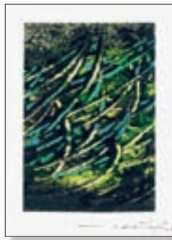
Ezra Pound, studi 2007, 20x30 cm € 360,00